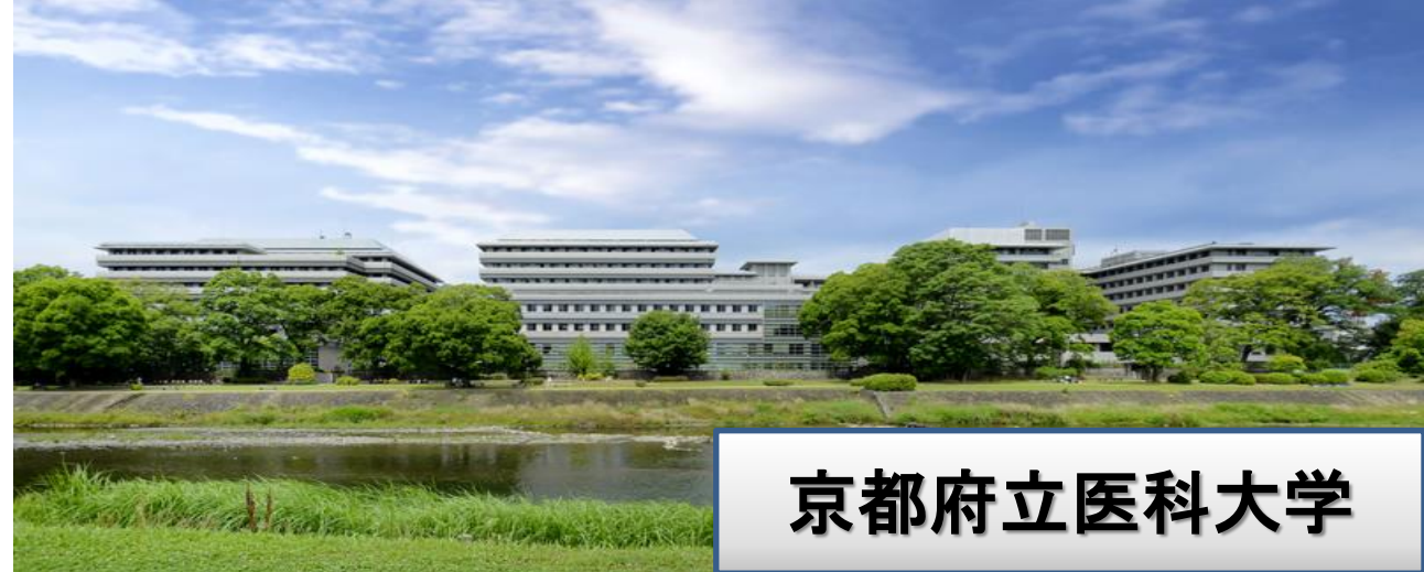
京都府立医科大学