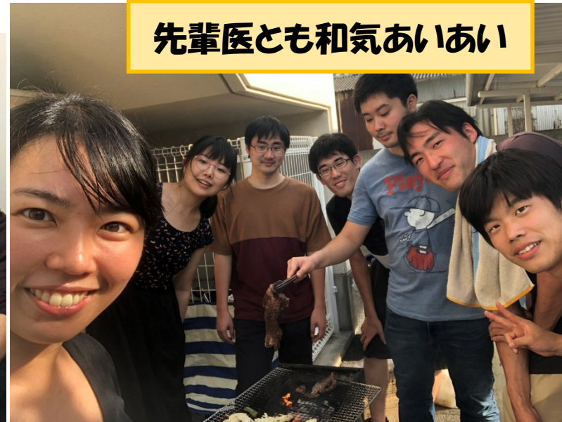
先輩医とも和気あいあい