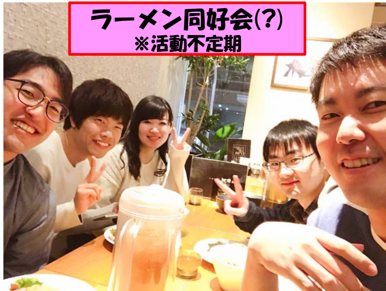
ラーメン同好会(?) ※活動不定期