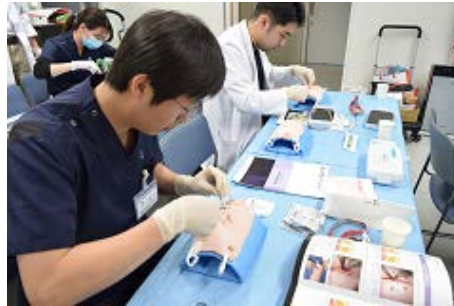
豚真皮による 埋没縫合トレーニング