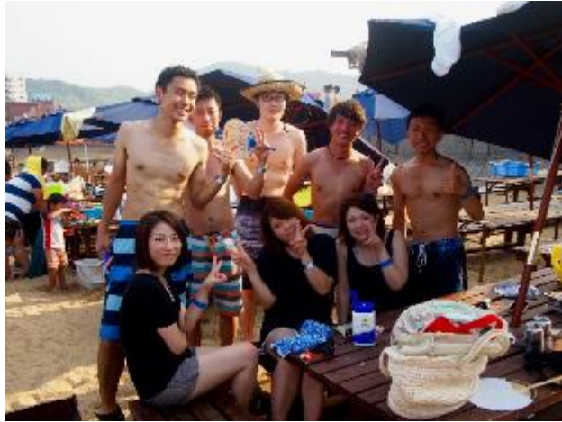
フットサルチームで バーベキュー