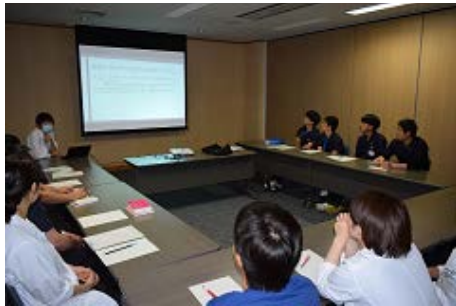
感染症レクチャー

初期研修医全員対象の各種勉強会の開催 トレーニングモデルを使用した内視鏡検査の実習 (症例検討、抄読会、スキルスラボetc)